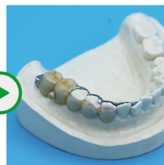
色は周りの歯に合わせるので、見た目も美しい